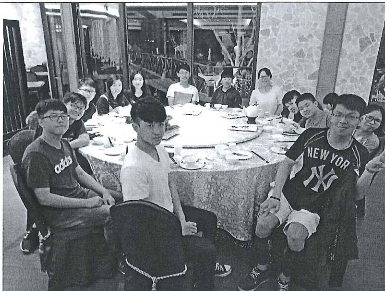
活動照片 (兩至四張)

課程的學習上也都穩定上軌道。由於大部分同學在大三開始要面臨專業領域選擇，專題餐與，以及是否決定要申請五年學碩等升學相關事項，在聚餐座談時，也分享了電機類研究所的分組及目前研究所升學管道，也提供了電機系的專題選項，以及專題課程的時程，讓導生可以提早規劃進一步升學的準備。聚餐之後，也陸續有幾位導生私下約時間諮詢升學,專題,或交換學生等等，藉著這次聚餐可以多增加跟導生們的互動，這學期還會持續追蹤學生們適應大學生活的情形。