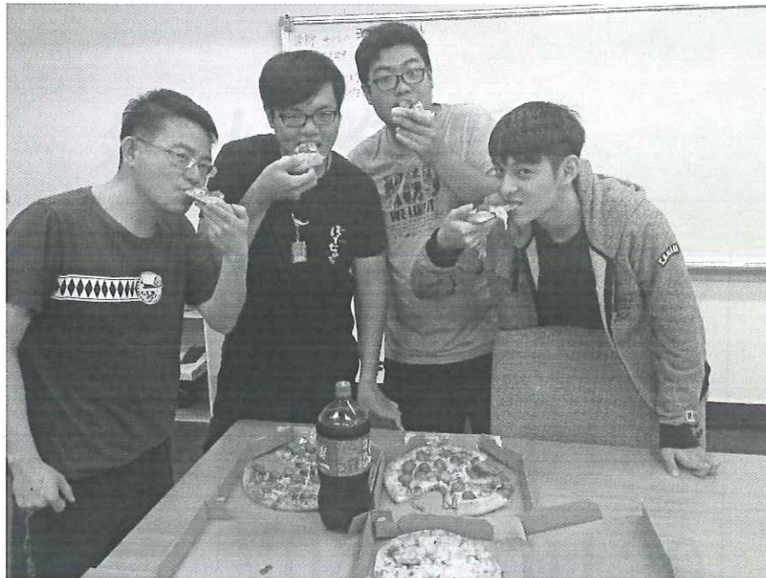
活動照片 (兩至四張)