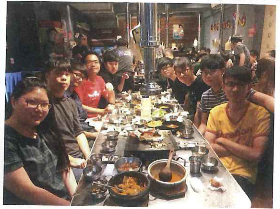
當天聚餐地點（如往常地都快吃完了才想到要照相）