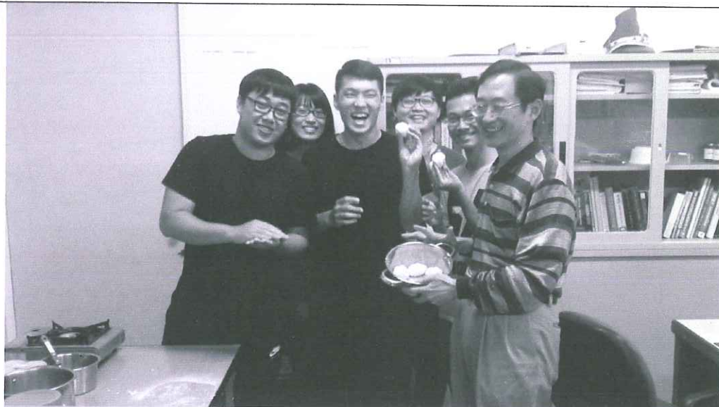
活動照片 (兩至四張)